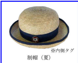
※内側タグ 制帽 (夏)