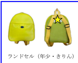
ランドセル (年少・きりん)