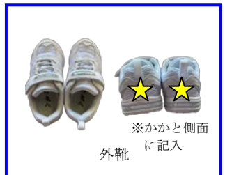
★ ※かかと側面 に記入 外靴