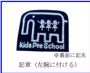
※裏面に記名 記章 (左腕に付ける)