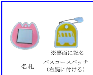
※裏面に記名 バスコースパッチ (右腕に付ける) 名札