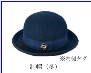
※内側タグ 制帽 (冬)