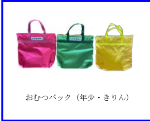
おむつバック (年少・きりん)