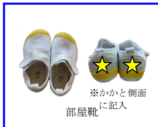
★ ※かかと側面 に記入 部屋靴