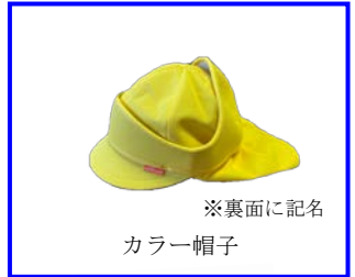
※裏面に記名 カラー帽子