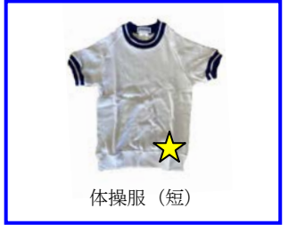
★ 体操服 (短)