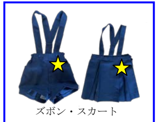
ズボン・スカート