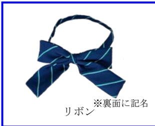
※裏面に記名 リボン