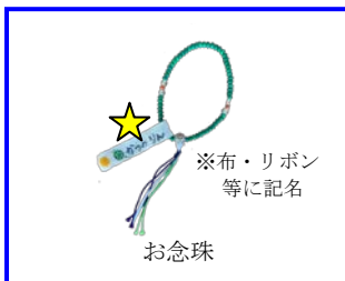
★ ※布・リボン 等に記名 お念珠