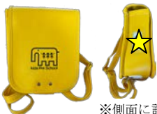
※側面に記入 ランドセル (年長・年中)