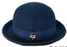
※内側タグ 制帽 (冬)