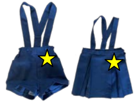
ズボン・スカート