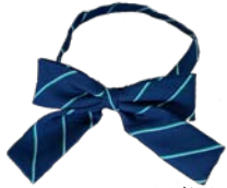
※裏面に記名 リボン