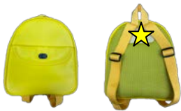
ランドセル (年少・きりん)