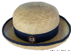
※内側タグ 制帽 (夏)