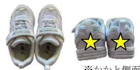
※かかと側面 に記入 外靴