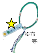
※布・リボン 等に記名 お念珠