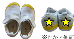
※かかと側面 に記入 部屋靴