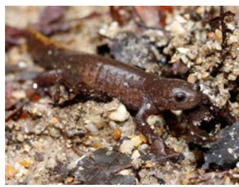
ヤマトサンショウウオ