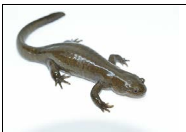
クロサンショウウオ

幼稚園新しいお友達がやってきました。この時期、自然の生き物と関わることは情操の発育になくしてはならないものです。年長、年中は直にお世話をする事で、年少、きりん組はお世話をする先生の様子を見ることで情操は育まれていきます。泣いて登園する年少、きりん組のお子様も「カメさんを見に行くよ！金魚さんを見に行くよ！」の声かけですっかりご機嫌になってしまいます。他園ではこうした活動は難しいようですが、木田幼稚園ではこうした活動をとおして、情操教育、自然保護への大切さを幼児期から学びます。保護者の皆様も大変珍しい貴重な生き物です。機会がありましたら是非ご覧下さい。